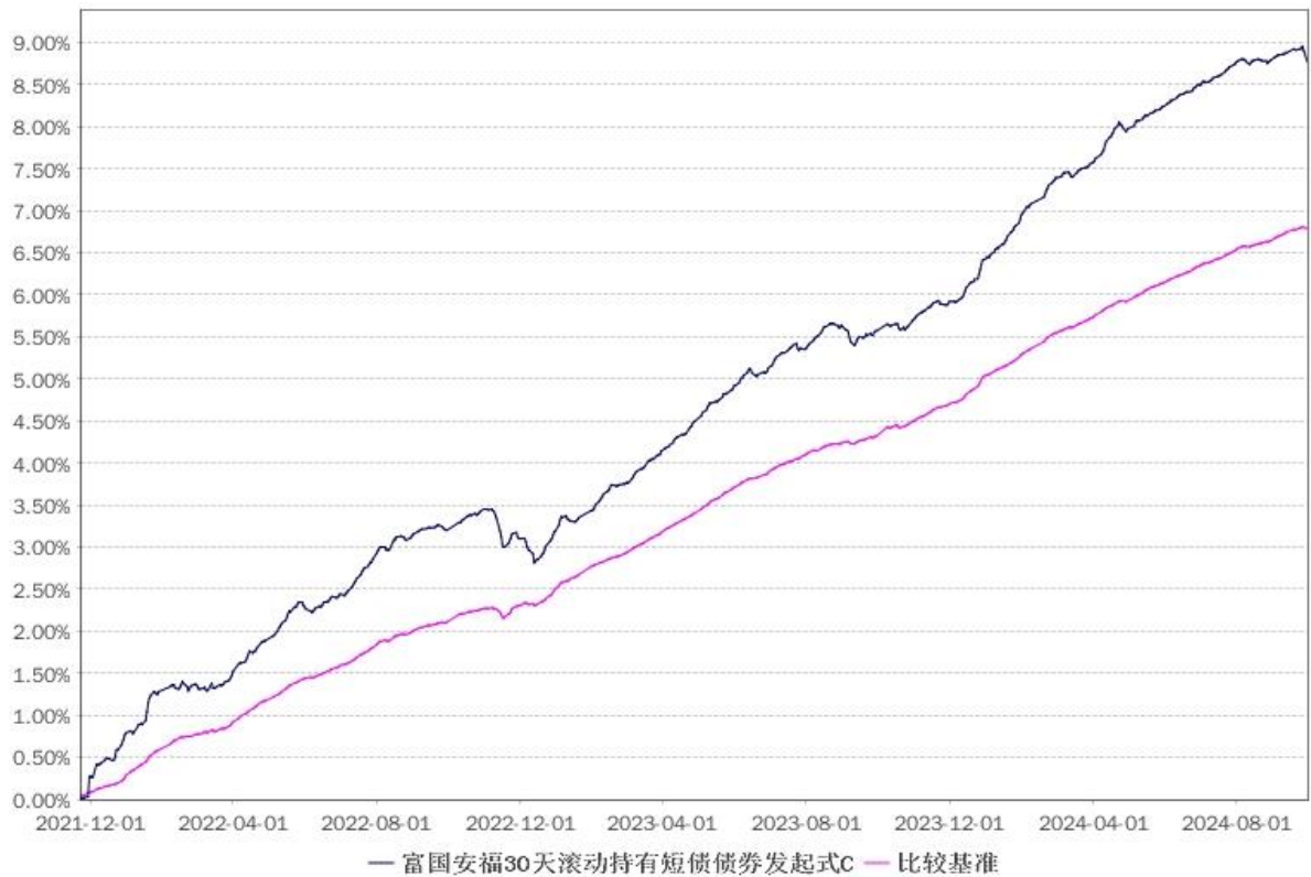
净值增长率与业绩比较基准收益率的历史走势对比图