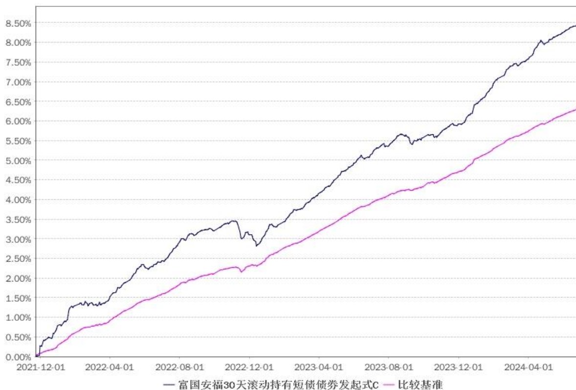
净值增长率与业绩比较基准收益率的历史走势对比图